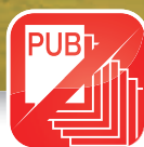
Filtre antispam de messagerie