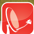
Connexion Internet par Satellite